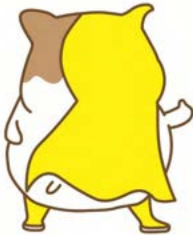
マスコットキャラクター 「かにゃお」